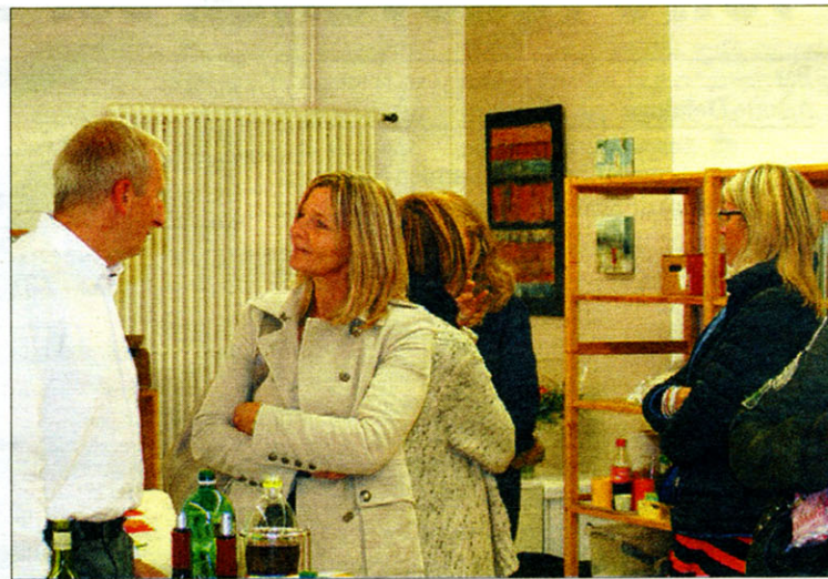
Un petit apéro était offert aux visiteurs.